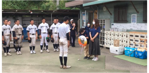
マネージャーから手づくりお守りが送られました。 父母の会からはすてきな千羽鶴が送られました。