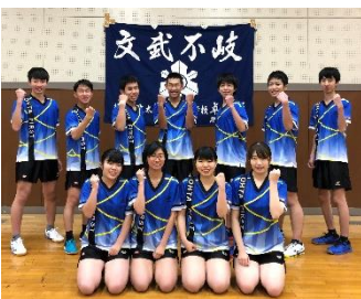
男子卓球部関東大会出場