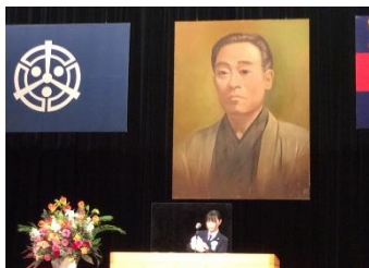
弁論部全国大会入選